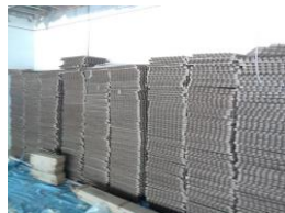
Montados na obra