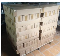
Modulo antes de montados